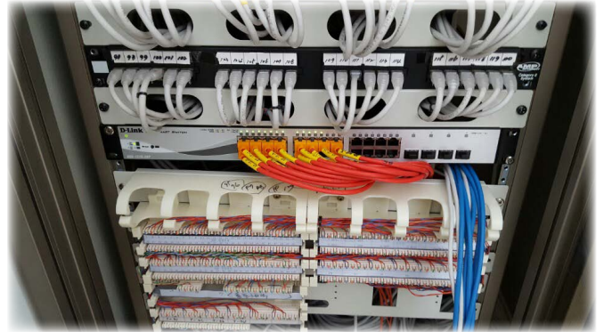
< 층별로 설치된 스위치 사진 >