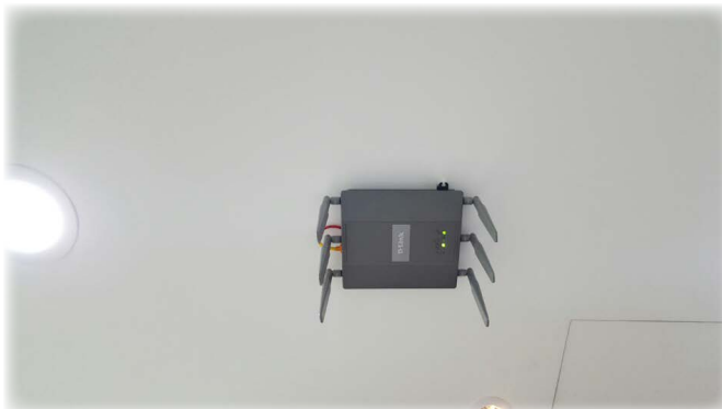
< 각 층에 설치된 AP사진 >