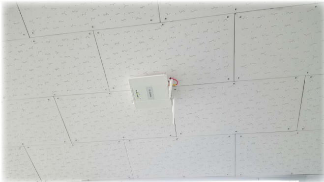
< 각 층에 설치된 AP사진 >