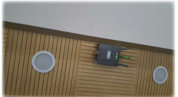
< 각 층에 설치된 AP사진 >