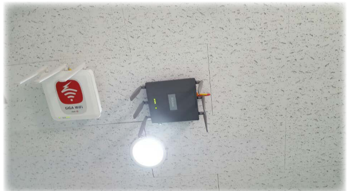
< 각 층에 설치된 AP사진 >