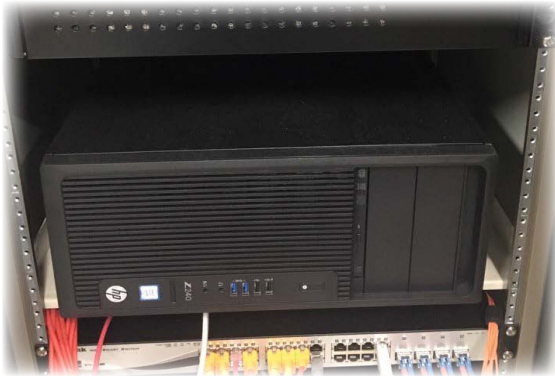
< 관리형 컨트롤러 CWM 설치 >